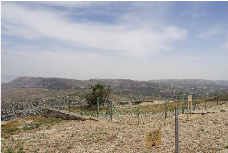
基立心山上撒玛利亚人献祭的地方

后来，公元 5 世纪，拜占庭皇帝泽农决定在撒玛利亚基立心山的圣域建造一座教堂，纪念圣母马利亚 (Mary Theotokos)。这导致了撒玛利亚人的反抗和抗议。最终引来镇压，撒玛利亚人急剧减少，现在只剩下了 600 多人。时至今日，他们还是在这山上敬拜。